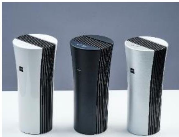
Aeropure® series P