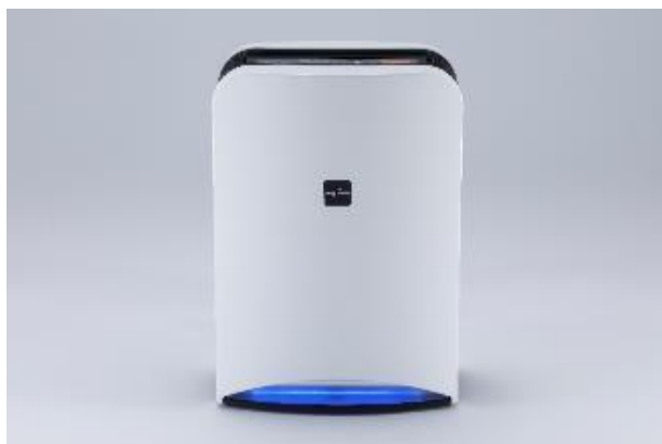
Aeropure® series S