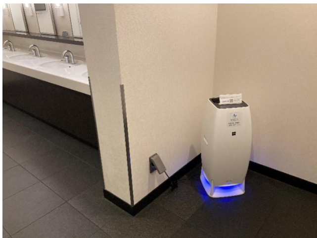
男子化粧室（手洗い場傍）